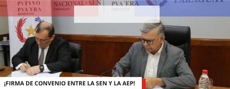
¡FIRMA DE CONVENIO ENTRE LA SEN Y LA AEP!