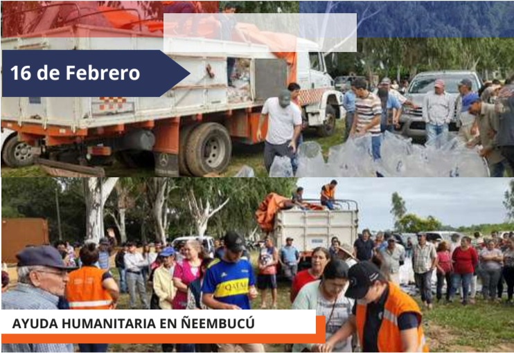
AYUDA HUMANITARIA EN ÑEEMBUCÚ

568 familias del distrito de Mayor Martínez y Villalbín, recibieron aproximadamente 12.500 kg de alimentos. La ayuda forma parte de la donación de la República de China Taiwán