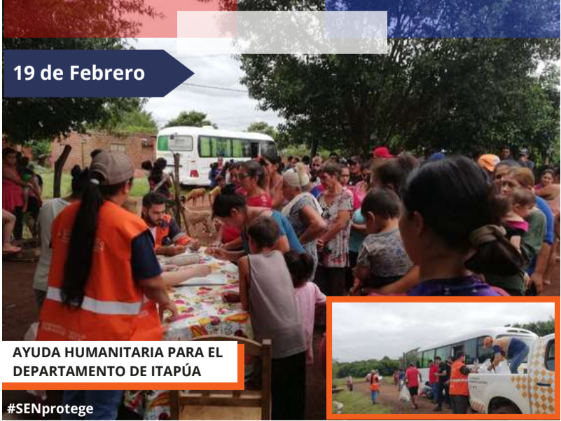
AYUDA HUMANITARIA PARA EL DEPARTAMENTO DE ITAPÚA