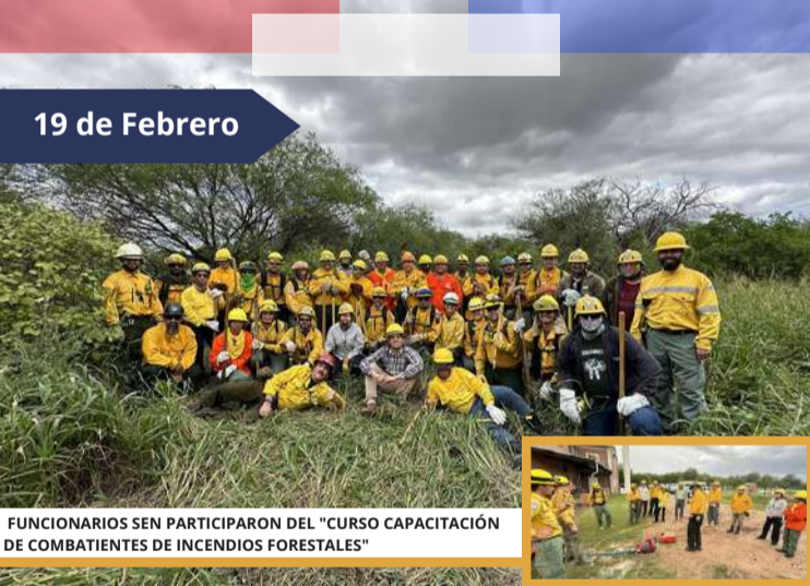
FUNCIONARIOS SEN PARTICIPARON DEL "CURSO CAPACITACIÓN DE COMBATIENTES DE INCENDIOS FORESTALES"

En el curso, los funcionarios técnicos bomberos de la SEN adquirieron conocimientos básicos sobre el control y supresión de incendios forestales, y redundará en beneficios tanto para nuestra institución como para los participantes, debido a que estarán capacitados para responder positivamente cuando la situación requiera de sus conocimientos