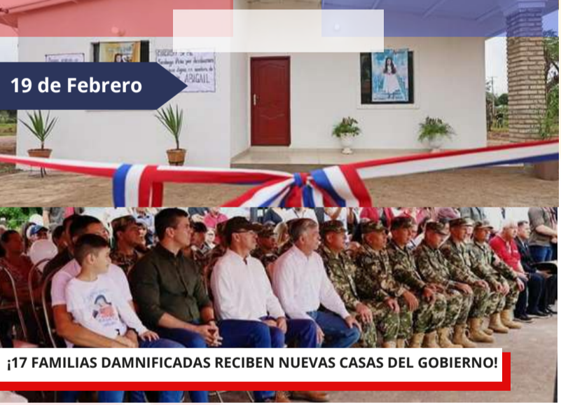
¡17 FAMILIAS DAMNIFICADAS RECIBEN NUEVAS CASAS DEL GOBIERNO!

En Guaicá, Santaní. El Gobierno Del Paraguay entregó una casa nueva a cada familia que perdió su vivienda en un fuerte temporal el 2 de noviembre del año pasado. Son 17 las familias que gozarán de las comodidades de un nuevo hogar.