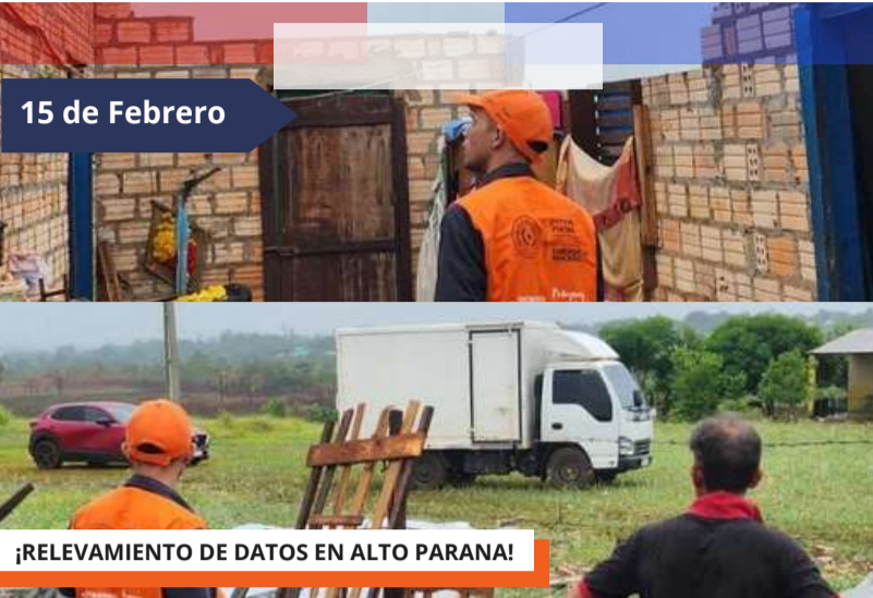
¡RELEVAMIENTO DE DATOS EN ALTO PARANA!

Llegamos al departamento de Alto Paraná donde hemos constatado que varias familias del distrito de Minga Guazú fueron afectadas por el temporal, personal técnico se encarga de realizar el relevamiento de datos para una pronta asistencia.